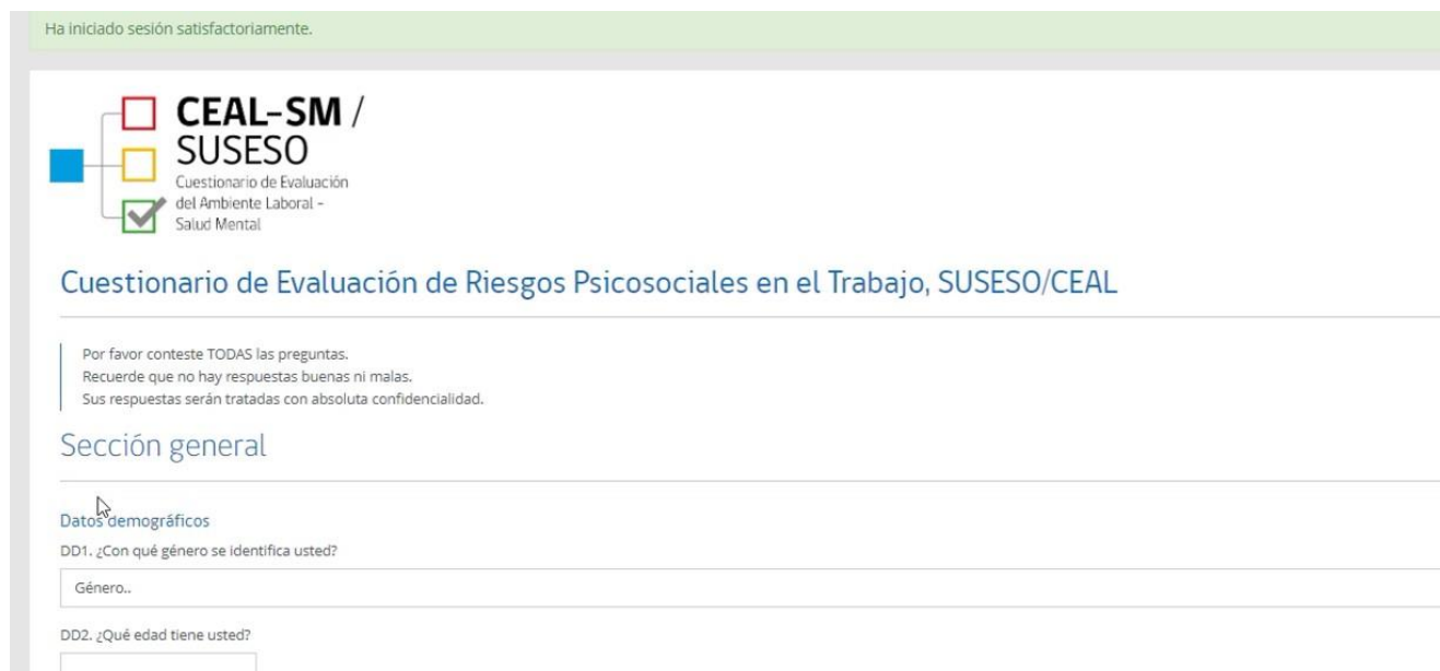
Figura 31: Cuestionario de evaluación de riesgos psicosociales en el trabajo, CEAL-SM.

Este link será informado por el RCT o por quien el Comité de Aplicación determine. Para abrir el cuestionario, se debe ingresar el nombre de usuario y contraseña que previamente le fue entregada por el RCT (figura 14). Una vez ingresada la combinación “usuario/contraseña” se desplegará el cuestionario y estará listo para ser respondido (figura 31).